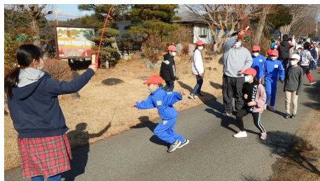
【大なわの部】なかよし班 1班