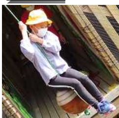
↑ アスレチック [DOKIDOKI] ↓