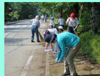
クリーン活動【黒羽地区】