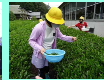
茶摘み体験【須賀川地区】