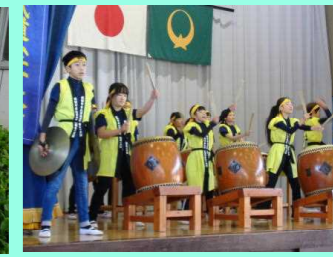
農民道全一太鼓【両郷地区】