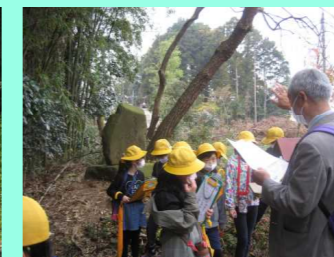
地域探訪【川西地区】